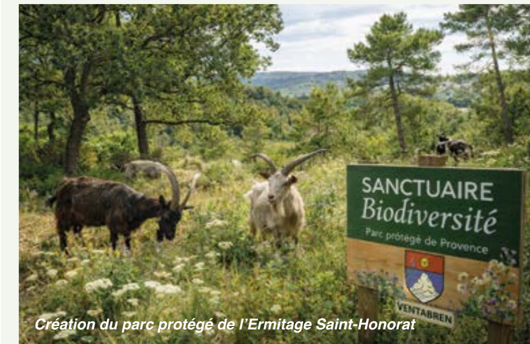
Création du parc protégé de l'Ermitage Saint-Honorat